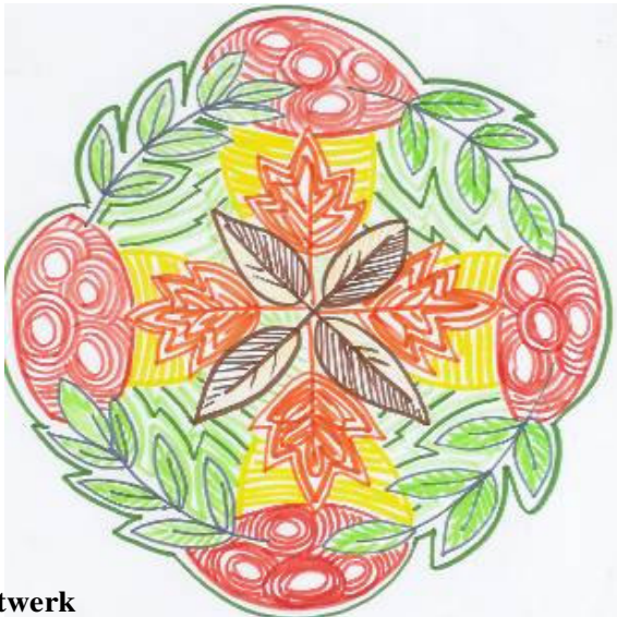
stiftwerk ontwerpen, invullen, lijnen volgen