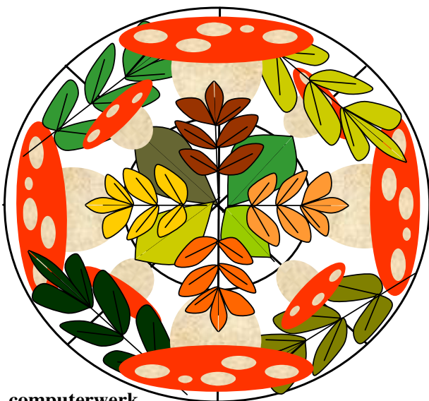
computerwerk ontwerpen, plakken, knippen, invullen