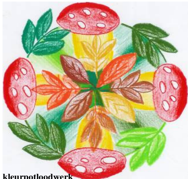
kleurpotloodwerk ontwerpen, licht-donker, kleurverloop, mengen