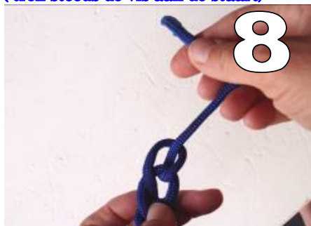
8 hierdoor wordt je haakwerk afgeknoopt