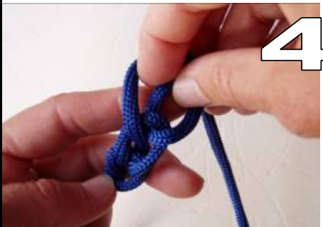
4 pak door de nieuwe lus weer de draad (of duw deze door de lus)