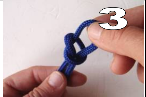
3 trek de draad verder door de lus (trek de vis uit het water) slipsteek