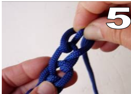
5 pak steeds opnieuw de draad door de lus (trek steeds de vis aan de staart)