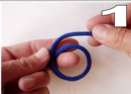
1 maak een lus met het eind boven (maak een vijver)