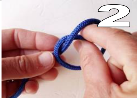
2 pak het touw door de lus (pak de vis)