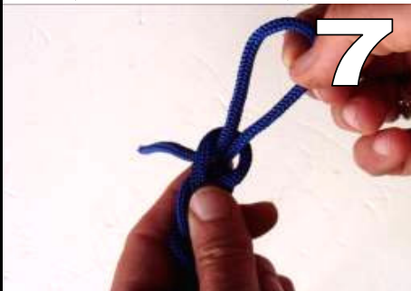
7 trek het uiteind door de lus