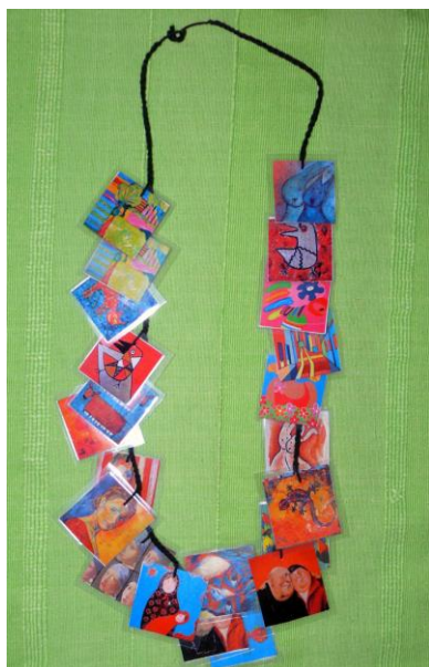
Foto's van werkstukken