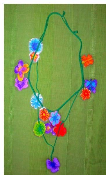
Tekeningen op papier