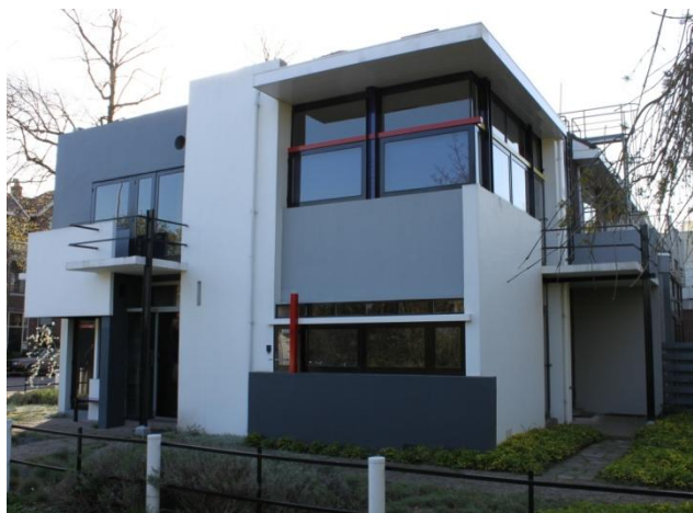
wikipedia Rietveldhuis Nederland wikipedia Sagrada Familia Gaudi Spanje wikipedia London Tower Engeland