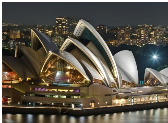
wikipedia Opera House Australie

papier en karton kleuren verven papier-maché en plastic erwten en satéprikkers wolkenkrabber