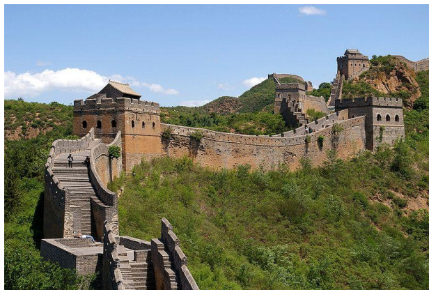
wikipedia Chinese muur China